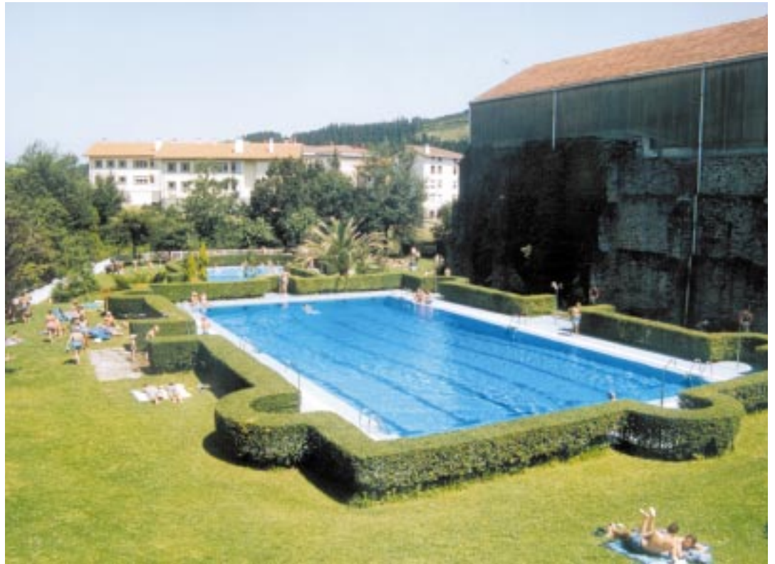
Urte osoan zaintzen dira instalazioak.

Jendeak ezagutzen ez dauen erronka izaten dau urtero-urtero Areatzako Udalak aurrez aurre. Alde batetik, igerilekuak bete behar dira eta herrikoak edateko urik gabe utzi dezake horrek (igerileku handia betetzeko 700.000 litro behar dira eta 300.000 litro txikirako). Beste arazo bat urtean zehar egiten den mantenua da. Igerileku-sasoia zabaldu baino lehen osasun-azterketa zorrotza egiten da eta, gaur egunera arte, beti gainditu izan da ondo baino hobeto. Horren ostean, lehia-keta bidez, txartel-leihatila,