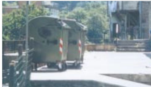
El medio ambiente, tema fundamental en la Agenda Local 21

Local y pone en práctica las estrategias comunes de desarrollo a nivel comarcal.