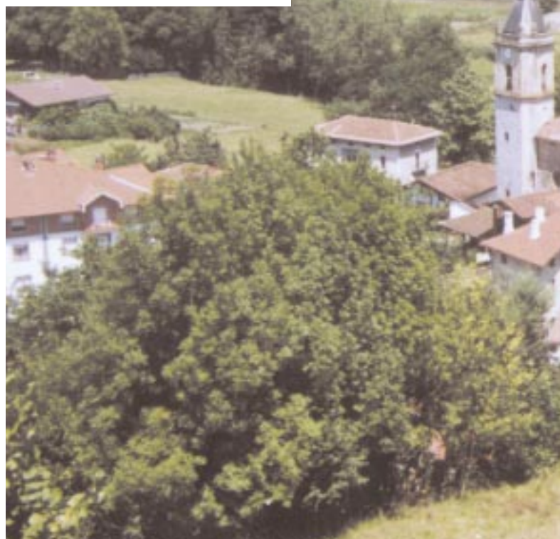
Areatza formará, en breve, parte de los municipios gasificados.

problema del abastecimiento de gas doméstico se resolverá mediante la colocación en las afueras de Areatza de dos depósitos ampliables de 45 m 3 . De estos depósitos partirá un tubo, cuyo diámetro será compatible con la red de Gas Natural en un futuro. Los tubos irán por el subsuelo del