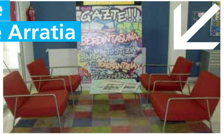
En la foto se ve vacía, pero la oficina continúa ofreciendo su servicio y además optimizado.

para mantener la estructura del programa, pero el Gobierno Vasco no subvenció ninguna de las acciones propuestas desde los municipios de Arratia. Por eso, ante la necesidad de optimizar los gastos, Gorbeialde y los Ayuntamientos han decidido aprovechar la situación para reflexionar sobre las políticas de juventud, incluyendo el servicio ofrecido por la OIJ. La información recabada ayudará a establecer un nuevo enfoque y una nueva programación.