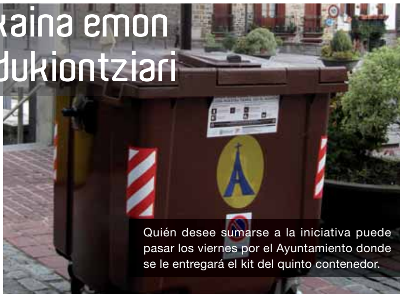
Quién desee sumarse a la iniciativa puede pasar los viernes por el Ayuntamiento donde se le entregará el kit del quinto contenedor.

Informazio kanpainari esker, Arratiako 1.565 familia inskribau dira (%28), baita 85 ekoizle handi (supermerkatuak, fruta-dendak, jantokiak, jatetxeak, tabernak, enpresak, etabar (%89). Ondino be badau egitasmoagaz bat egiteko aukerea, eta beraz tokian tokiko udaletxetan informazioa jasotzeko aukerea be bai.