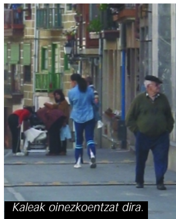
Kaleak oinezkoentzat dira.

Hartutako neurri honeek ez dira aparkamenduaren eta