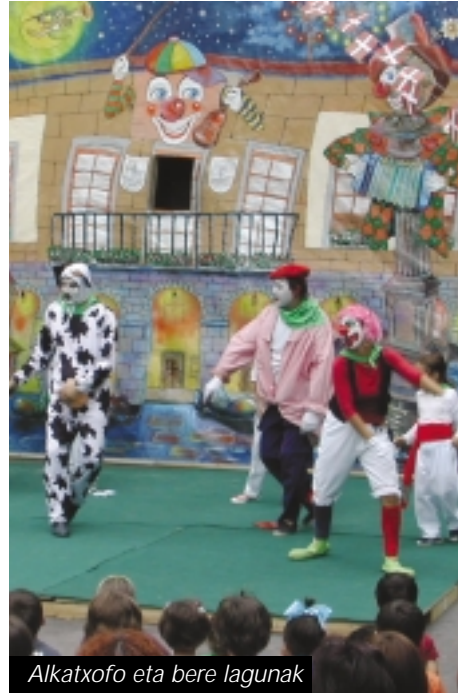
Alkatxofo eta bere lagunak

Areartzan honelako ekitaldi bat egitea errazagoa da Bilbon edo beste herri handiago baten baino. Hemen familia handi bat bezala gara. Denok ezagutzen gara eta horrek konplizitate eukitzea errazten dau.