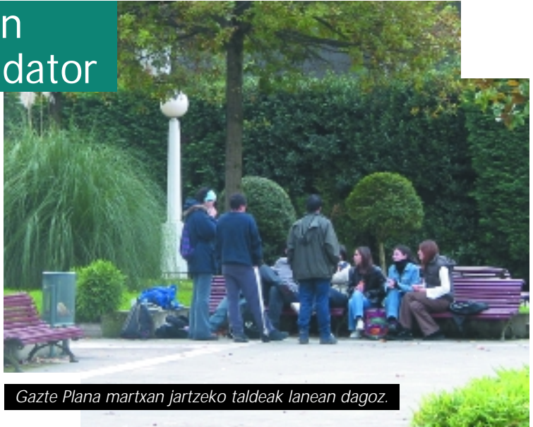
Gazte Plana martxan jartzeko taldeak lanean dagoz.

GORBEIALDE landa garapenerako alkartea, Gorbeialderako Gazte Plana egiten dabil. Gazte Plana gauza estrategikoa da eta Euskadiko giza kohesioa bultzatu nahi dau. Plan osoa sektoreartekoa eta erakundeartekoa da. Irekia eta giza parte-hartzea behar dauan plana.